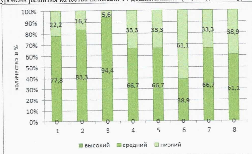
Рисунок 2. Уровень сформированности отдельных качеств дошкольников на начало года

Анализ сформированности качества «Овладевший универсальными предпосылками учебной деятельности» показал, что на начало года высокий уровень развития качества не показал никто, средний уровень развития качества показали 14 дошкольников (88,8 %), низкий уровень - 1 дошкольника (11,2 %).