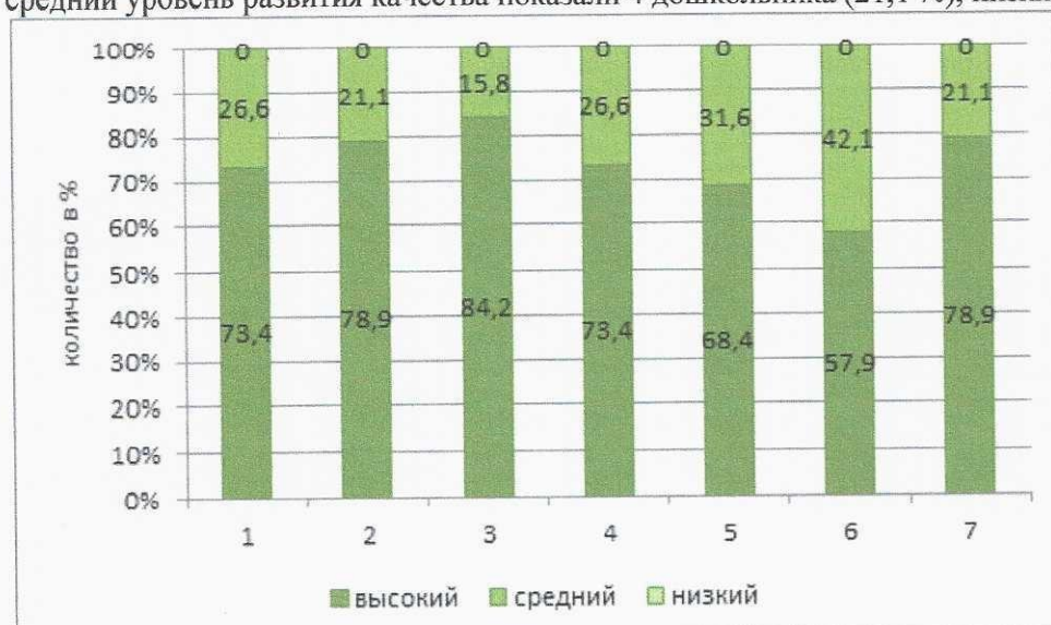
Рисунок 6. Уровень сформированности отдельных качеств дошкольников в по итогам года (май)

Анализ сформированности качества «Овладевший универсальными предпосылками учебной деятельности» показал, что высокий уровень развития качества показали 11 дошкольников (78,9%), средний уровень развития качества показали 4 дошкольника (21,1%), низкий уровень - не показал никто.