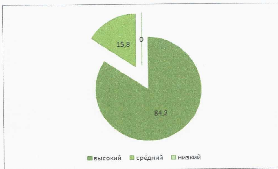
Рисунок 5. Общий уровень сформированности достижений воспитанников ДОУ (май)

В мае 2022 г. был проведен второй этап мониторинга планируемых итоговых результатов освоения детьми основной общеобразовательной программы дошкольного образования. Сводный протокол представлен в приложении 7. В исследовании приняли участие 15 дошкольников, один из которых был вновь прибывшим. В результате мониторинга высокий уровень развития показали 14 дошкольников (84,2 %); средний уровень - 1 дошкольника (15,8 %); низкий уровень не показал никто.