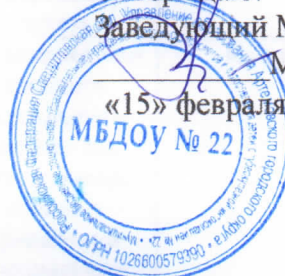
График проведения специальной оценки условий труда